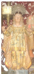
Primitiva Imagem de Santa Bárbara

7 de Dezembro: 15h00 - Eucaristia de Festa seguida de Procissão